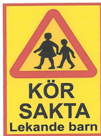
Figur 3- Förslag på varningsskylt

Emma Hamilton Stenkullavägen 6 439 53 Åsa 0790-688075