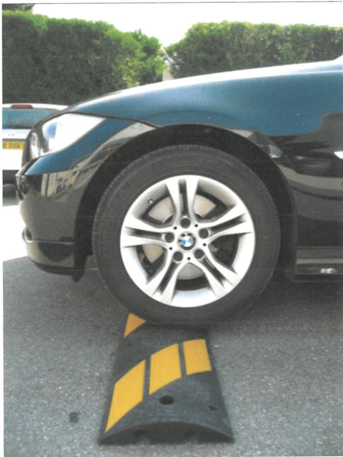
Figur 2- Exempelbild på farthinder, VISO EasySpeed 55, 30 km/h